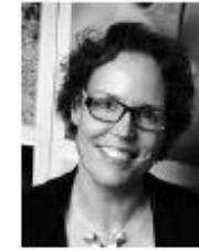
Programmasecretaris en coördinator lobby